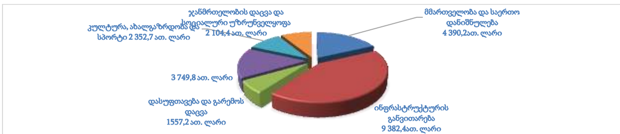
დიაგრ. N 2

ხარაგაულის მუნიციპალიტეტისათვის მთავარ პრიორიტეტს ინფრასტრუქტურის განვითარება - პროგრამული კოდი 02 00 წარმოადგენს, 2023 წელს აღნიშნულ პრიორიტეტზე გათვალისწინებული იყო 10 708,3 ათასი ლარის დახარჯვა, ფაქტიურად დახარჯულია 9 382,4 ათასი ლარი, გეგმა შესრულებულია 87,6-ით.