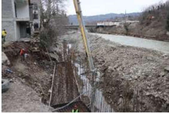
დაბა ხარაგაულში მდინარე ჩხერიმელას ნაპირდამცავი კედლის მშენებლობა