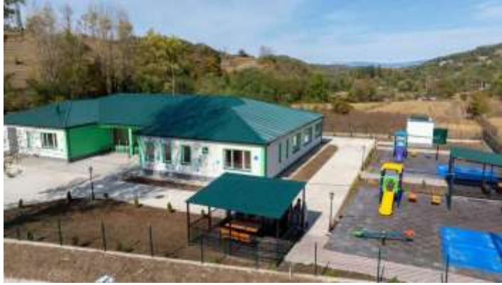
სოფელ კიცხში დასრულებული თანამედროვე სტანდარტებით აღჭურვილი საბავშვო ბაღი

წინამდებარე ანგარიშში ასახული მონაცემები, რომლებიც შეეხება ზემოთ დასახელებულ ეკონომიკურ, ინფრასტრუქტურულ და სხვა სფეროებში განხორციელებულ საქმიანობას, ყველა მათგანი დაგეგმილი და განხორციელებულია მუნიციპალიტეტის მერიის შესაბამისი სამსახურების მიერ, ხოლო საკრებულოს, მერიის მიერ ინიცირებულ აღნიშნულ საკითხებზე, მათ განსახორციელებლად მიღებული აქვს შესაბამისი სამართლებრივი აქტები განკარგულებებისა და დადგენილებების სახით. აგრეთვე, საკრებულო როგორც მაკონტროლებელი ორგანო, პერიოდულად ისმენს და აფასებს მუნიციპალიტეტის მერიის სამსახურებისა და ა (ა) ი კ - ის ანგარიშებს გაწეული საქმიანობის შესახებ. ამდენად, აღმასრულებელი ორგანოს საქმიანობის ამსახველი მონაცემების გარეშე საკრებულოს მუშაობის ცალკე განხილვა პრაქტიკულად შეუძლებელია, ვინაიდან თვითმმართველობა გულისხმობს თვითმმართველობის წარმოდგენლობით და აღმასრულებელ ორგანოთა ერთიან ორგანიზმად არსებობას. დარწმუნებული ვარ წარმომადგენლობითი და აღმასრულებელი რგოლის კოორდინირებული მუშაობის შედეგად მომავალშიც ბევრ სასიკეთო საქმეს გავაკეთებთ ჩვენი მუნიციპალიტეტისათვის.