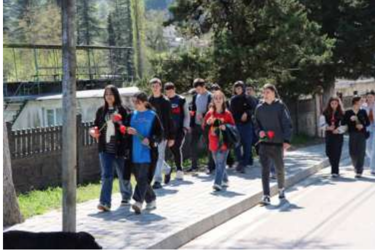
ახალგაზრდული საკრებულოს წევრები ტიტებით 9 აპრილის სკვერისკენ

ახალგაზრდებმა აგრეთვე აღნიშნეს დედამიწისა და ბავშვთა დაცვის საერთაშორისო დღე, ისინი აქტიურად ერთვებოდნენ სასკოლო ცხოვრებაში და არაერთი საინტერესო შედეგებითი და სპორტული ღონისძიება ჩაატარეს.