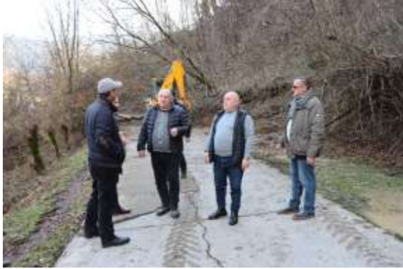
სოფ. სხლითი გზის გაწმენდითი სამუშაოები